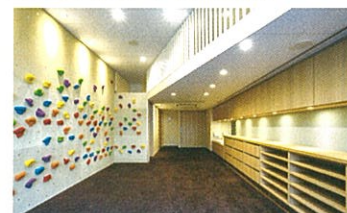
ボルダリングができる壁やトンネル状のロフトなど、運動能力も発達させる工夫を盛り込んだ園舎。