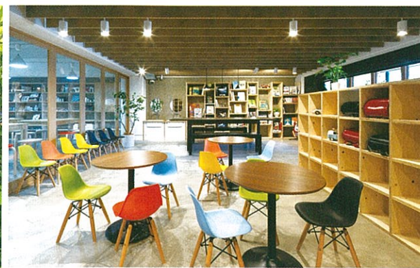
「子ども子育て総合研究所」での学童保育施設の第1弾となる「コピーアフタースクール+(プラス)代官山」は、2016年3月に開校し、新入生を迎える。

独自のメソッド「マトリクス保育」が好評の「コピープリスクール」を運営するコピーアンドアソシエイツ。「住まいは子育てのために」を信念とするミサワホームグループ。この2社の経営トップをお招きし、これからの子育て支援について語っていただいた。