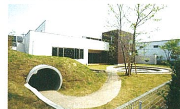
築山で変化をもたせた園庭など、好奇心を刺激するさまざまな「仕掛け」を採用した保育施設。

コピープリスクールみさとながとろ 2012年4月開園/ 第6回キッズデザイン賞受賞