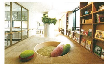
都市部の保育環境に配慮し、光環境設計や室内緑化システムを導入した都市型認可保育園。

コピープリスクールみさとながとろ 2012年4月開園/ 第6回キッズデザイン賞受賞